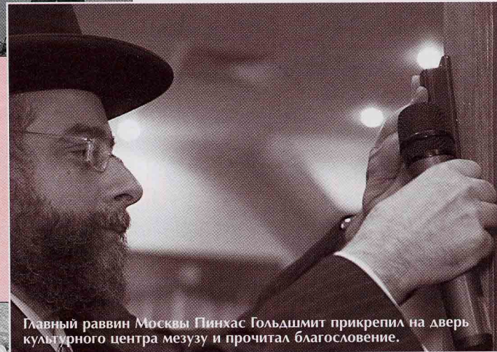
Главный раввин Москвы Пинхас Гольдшмит прикрепил на дверь культурного центра мезузу и прочитал благословение.

Открытие нового сезона в ЕКЦ на Никитской стало ярким культурным событием еврейской жизни Москвы